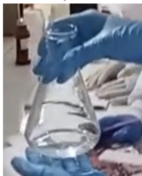
Gambar 2. Kondisi larutan setelah titrasi (terjadi perubahan warna).

Gambar 1 menunjukkan kondisi larutan sebelum titrasi, di mana larutan NaOH yang telah ditambahkan indikator fenolftalein berwarna merah muda. Warna ini menandakan suasana basa. Setelah titrasi dilakukan dan mencapai titik akhir, larutan berubah menjadi bening sebagaimana terlihat pada Gambar 2. Perubahan warna tersebut menunjukkan bahwa reaksi netralisasi telah berlangsung hingga mendekati titik ekuivalen.