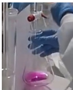
Gambar 1. Kondisi larutan sebelum titrasi (warna awal).

Berdasarkan data pada Tabel 1, diperoleh volume rata-rata HCl sebesar 5,26 mL. Dari nilai tersebut dihitung konsentrasi rata-rata NaOH sebesar 0,0526 M.